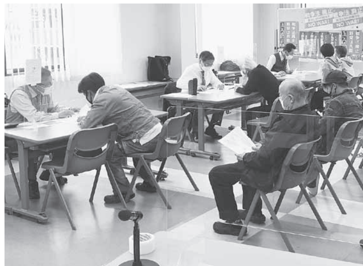
神戸共同経理事務所の協力を得た事前確認 (4月18日)